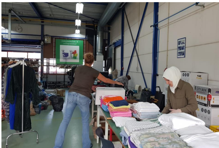
10 September: Vrijwilligers sorteren de kleding