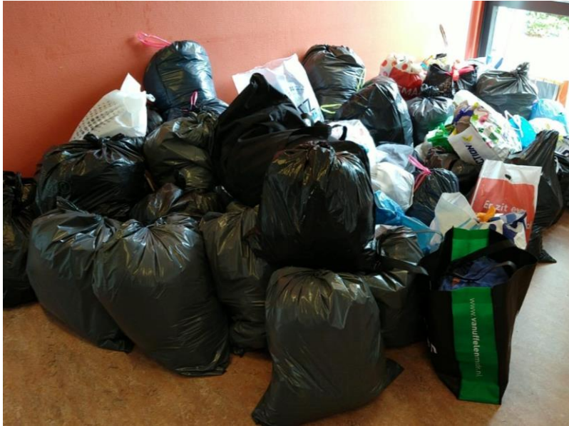
Donatie aan kledingbank Utrecht