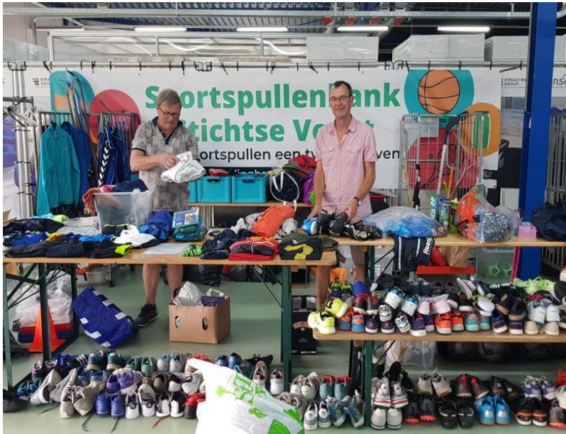
De eerste uitgifte van de sportspullenbank