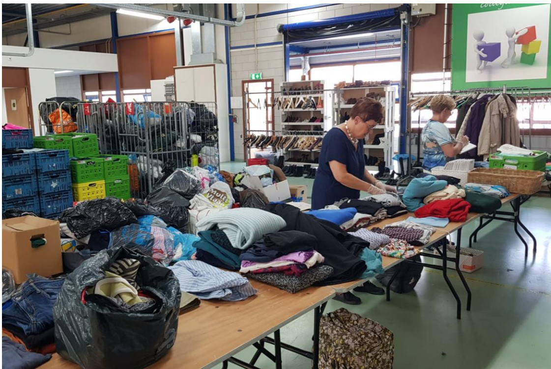
Vrijwilligers sorteren de kleding